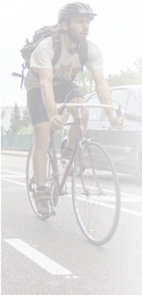
SECCIÓ CARRIL BICI EN APARCAMENT AMB ESPAI COMPARTIT AMB VEHICLES