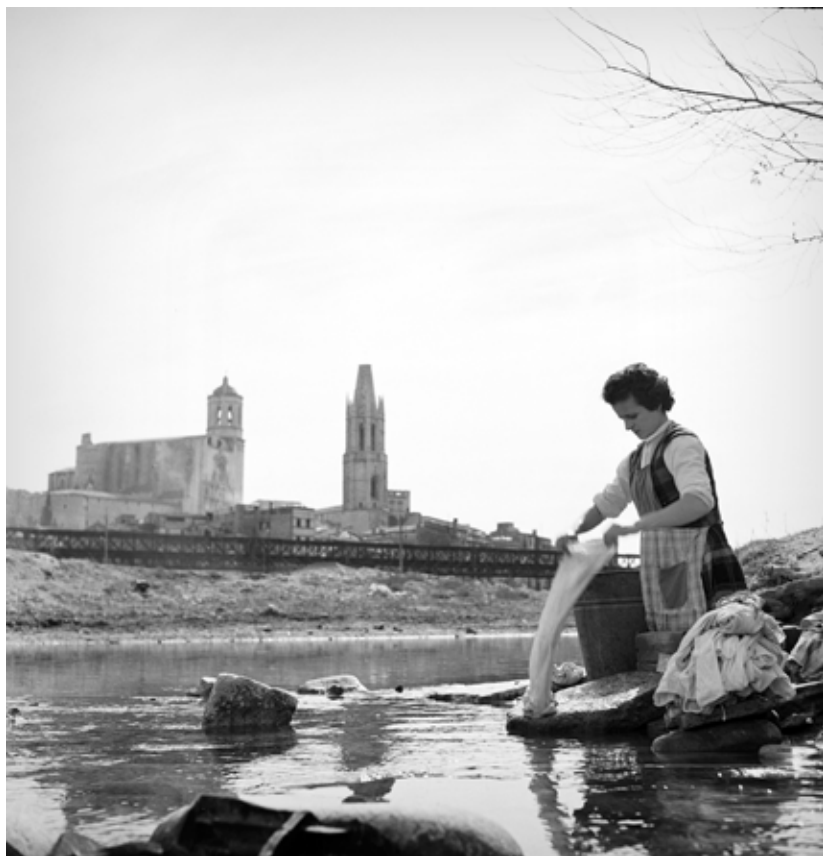
Dona rentant la roba al riu Ter. Al fons el pont del Ferrocarril, la Catedral i el campanar de l'església de Sant Feliu. 1960-1961.

“El riu Onyar, amb la mica d'aigua que arrossega, deixa clapes i marges eixuts on s'hi fa l'herba més tendra del món. Damunt d'aquesta herba dormen els gitanos i els pobres de Girona; tots els pobres de Girona són prims i esguerrats, tenen una edat indefinida i un aire d'ocells de pas amb una ala i una pota trencades. Damunt d'aquesta herba floreixen també els forns de les castanyeres. Les castanyeres de Girona resen contínuament o diuen uns renecs que esclaten d'una manera trista com les escopetes de pistó de la canalla. El fum de les castanyes, en fer-se fosc, es barreja amb la boira i dóna a l'ambient una sentida de guisat de les festes; aleshores, respirar una mica de boira amb fum de castanyes torrades resulta un aperitiu fet amb xiulets de merla i amb sospirs de núvia, un aperitiu delicadament rural.