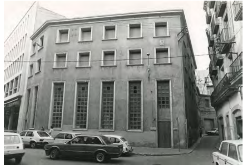
Façana de la Central Elèctrica del Molí, al carrer Santa Clara. Ajuntament de Girona. CRDI (Jordi S. Carrera), 1986.

Els dies que Don Ramon passava a Girona, que eren ben pocs durant l'any, el feia servir alguna vegada amb el candorós projecte d'arribar a visitar la central de Bescanó. La preparació, la neteja, l'arranjament del cotxe, era ja un espectacle; per fer honor a la majestuositat dels dos seients, també nosaltres ens posàvem majestuosos: una bata blanca amb un collet blau, una gorra de plat, i, ell, unes ulleres rodones i enormes que li cobrien quasi tot el rostre, i que, juntament amb el bigoti, negre i poblat, li donaven l'aspecte d'un cap de mosca monstruosa.