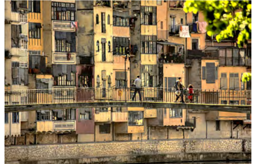
Les Cases de l'Onyar amb el pont d'en Gómez com a element central.

Vázquez, Eva, “La corba de la felicitat”, El Punt , 9-9-2002.