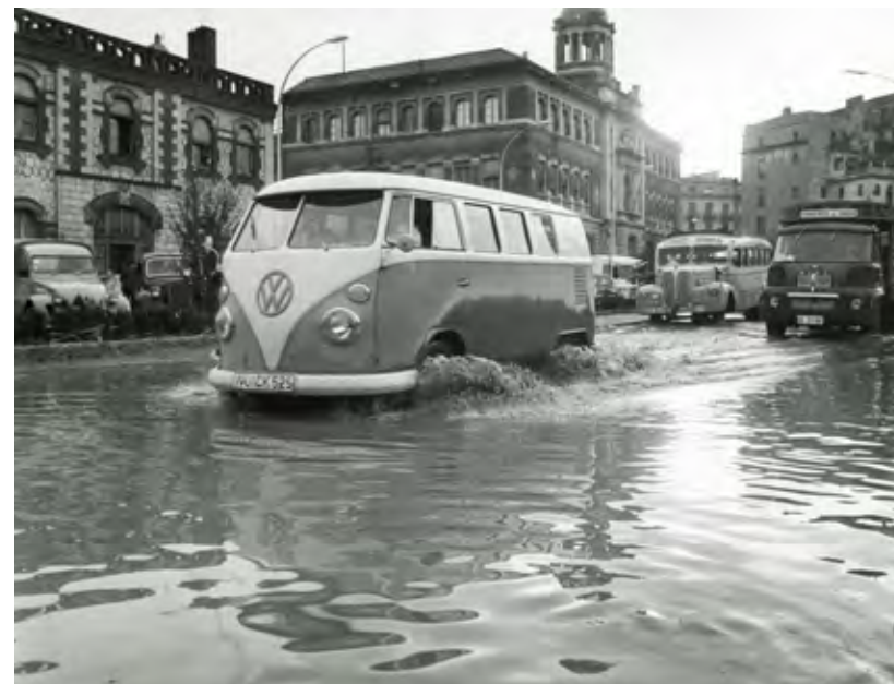
L'avinguda Ramon Folch inundada. En primer terme a l'esquerra, el parc de Bombers i al fons, l'edifici de Correus i Telègrafs. 10/12/1962.

Els Trisagis de tempesta grossa se solien resar en llengua oficial, que en coses del més enllà no hi és mai de més, un xic de diplomàcia.