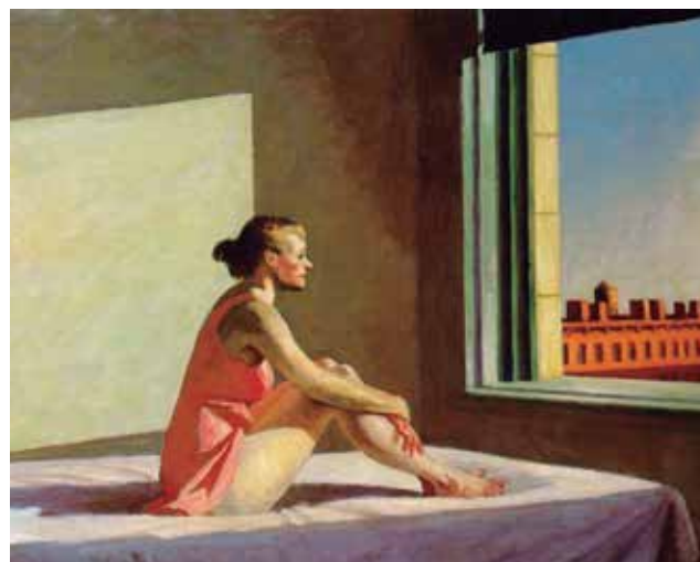
Escriu un quadre