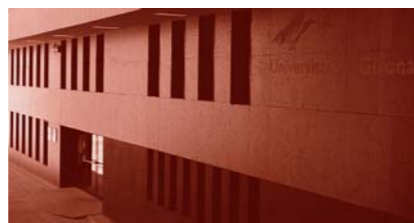
Fundació Universitat de Girona: Innovació i Formació

Dins de la formació a l'empresa s'ofereixen diferents productes: seminaris empresarials, cursos de diferent durada segons les necessitats de l'empresa, formació in company , així com programes d' outdoor training .