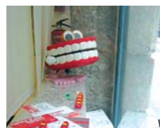
Centre de Normalització Lingüística de Girona Carrer Ciutadans, 18 17004 Girona Tel.: 972 220 663 A/e: cnlgi@cpln.cat www.cpln.cat/xarxa/cnlgirona

El Consorci per a la Normalització Lingüística (CPNL), creat l'any 1989, està format per la Generalitat de Catalunya, 80 ajuntaments, 37 consells comarcals i la Diputació de Girona. A través d'una xarxa de 22 centres de normalització lingüística desenvolupa estratègies i accions per garantir l'extensió territorial del coneixement i l'ús de la llengua catalana. L'Ajuntament de Girona forma part del Centre de Normalització Lingüística de Girona (CNLG), que té l'àmbit d'actuació en totes les comarques gironines, excepte la Cerdanya.