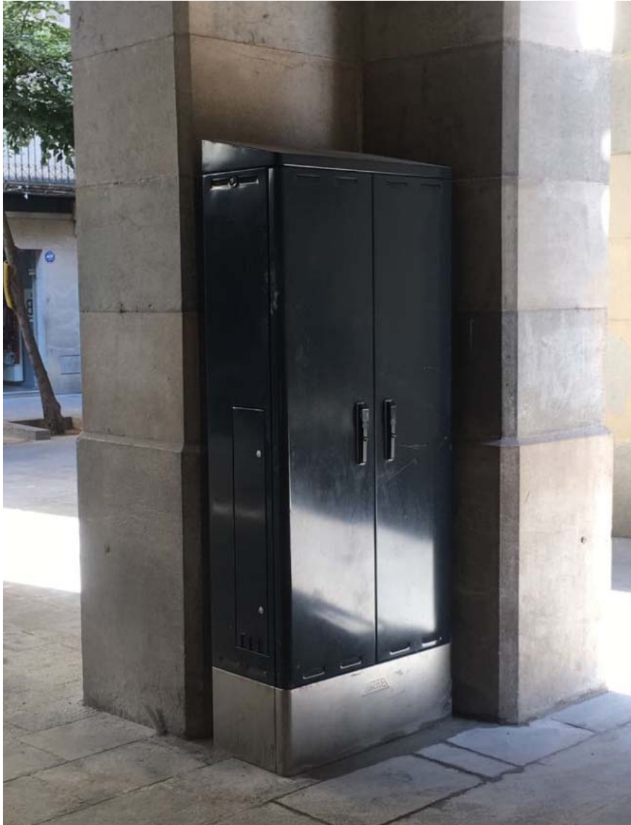
Detall armari quadre